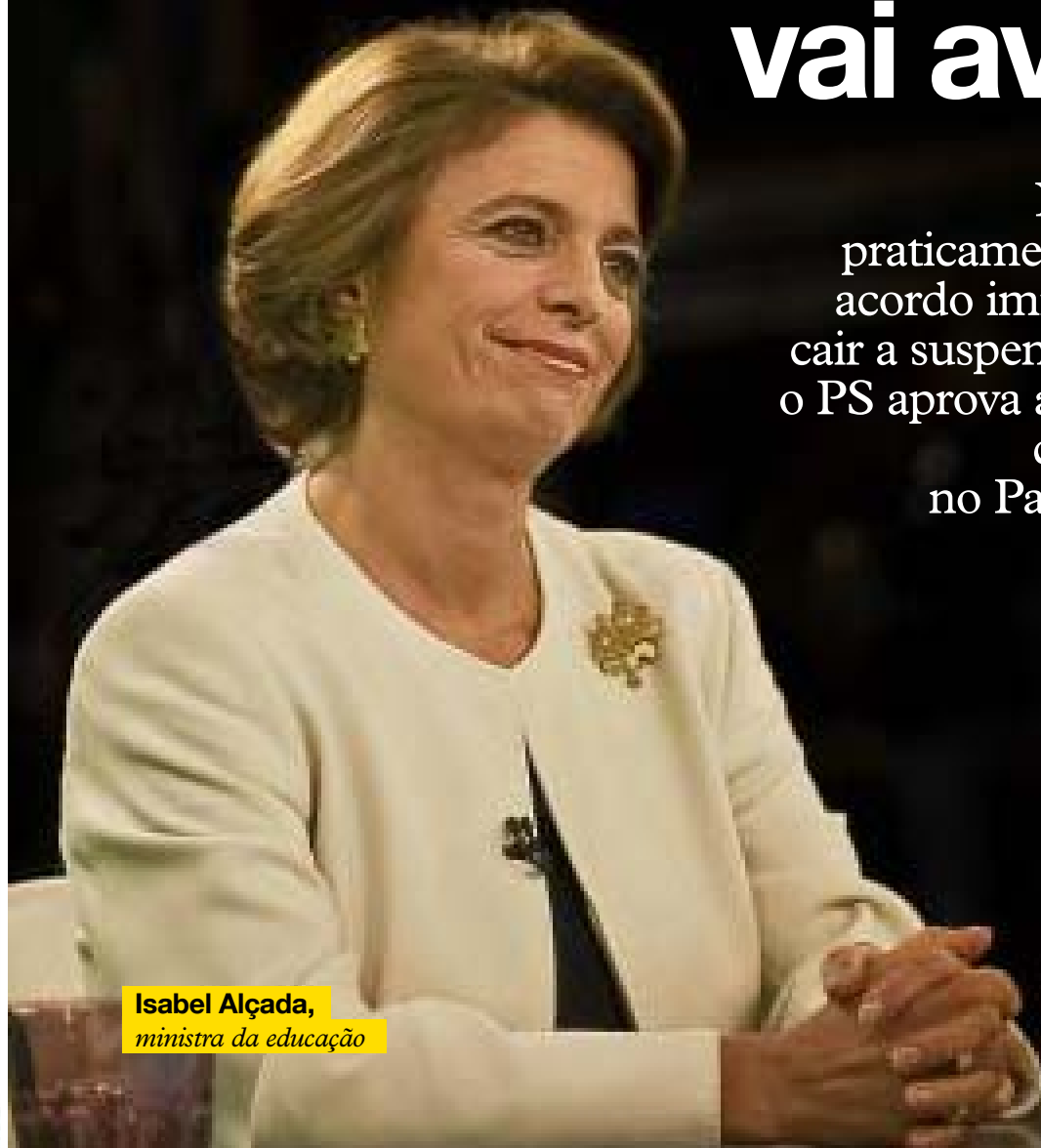
Isabel Alçada, ministra da educação

Negociações estão praticamente concluídas e o acordo iminente. PSD deixa cair a suspensão da avaliação e o PS aprova a proposta laranja, que já foi entregue no Parlamento // PÁGS. 30-31